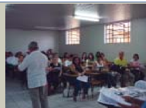
A preparação para a saída