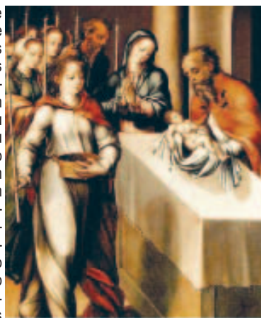
Apresentação de Jesus no templo, de Luis de Morales, o Divino, Museu do Prado, Madri, (XVI)

Como bom israelita, José segue estritamente a tradição de seu povo, e dentre as muitas prescrições contidas nesta tradição não faltavam aquelas inerentes aos deveres dos pais em relação aos filhos. Ora, José era pai, um pai não carnal no sentido biológico ou como aquele que contribui com seu sêmen para a geração do seu próprio filho e sim um pai virginal, mas nem com isso menos pai; aliás, ele era bem ciente do exercício de sua paternidade porque sabia muito bem que aquela criança que a sua esposa concebera era o Messias, o Salvador esperado ao longo dos séculos pelo seu próprio povo. Pois bem, a sua responsabilidade, a sua fé nas prescrições judaicas estabelecidas e, sobretudo a sua peculiaridade de homem "justo", atribuída pelo próprio evangelista, não lhes permitia que olvidasse mesmo os seus mais simples deveres paternos para com Jesus.