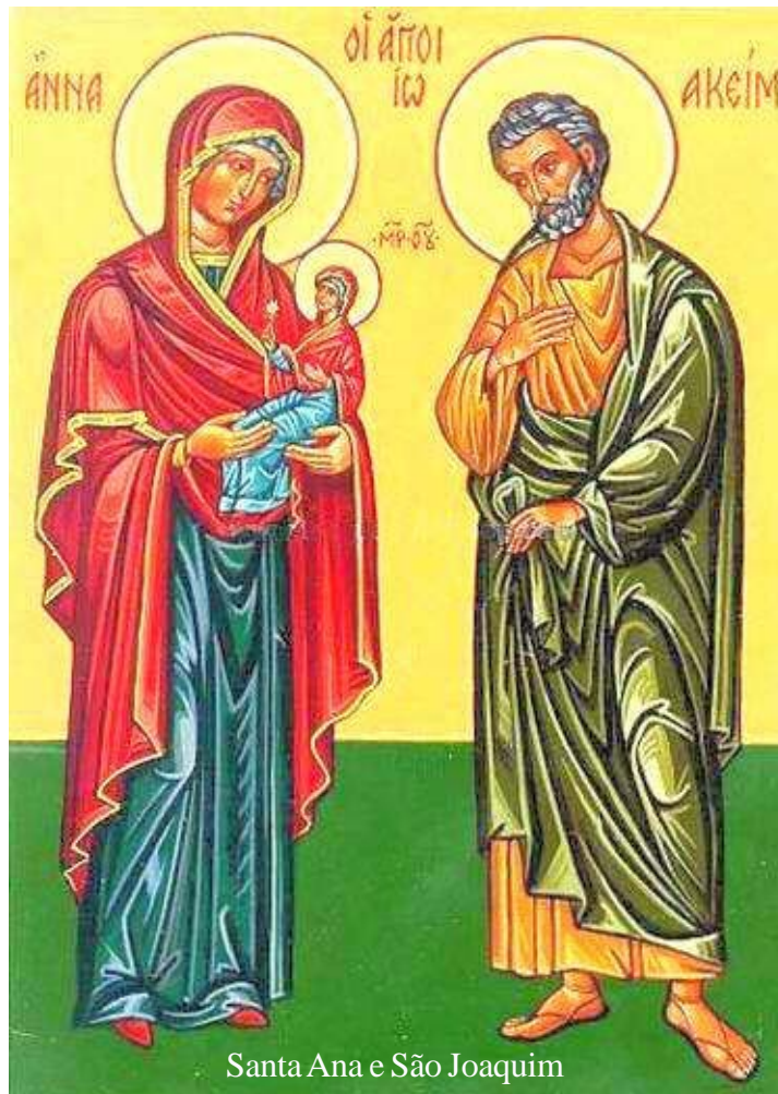
Santa Ana e São Joaquim

A Bíblia nos ensina a importância de respeitar os mais velhos. De ouvir os seus conselhos e de estar sempre junto a eles. São o símbolo da Sabedoria. Na família os avós desempenham a função de porto seguro, pois tem um papel fundamental na educação dos netos. Com sua alegria, disponibilidade, jovialidade e sabedoria, os avós sempre são a pedra, ou melhor, o segredo da boa educação.