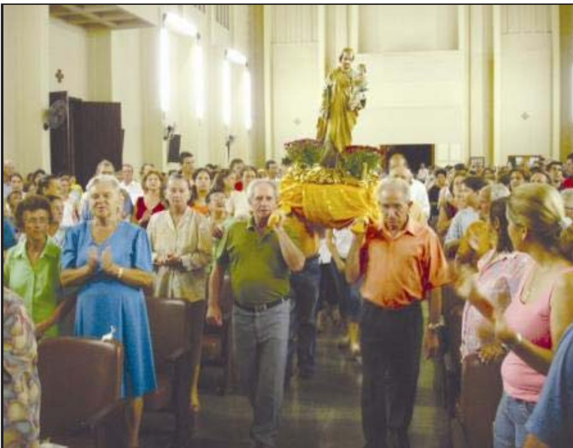
Milhares de devotos são esperados para a grande festa de São José Operário, patrono dos trabalhadores. As celebrações acontecem no dia 01º de Maio, com grande concentração de devotos no santuário. (Página 3)