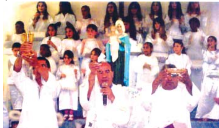
RCC - GRUPO SÃO JOSÉ MARELLO

Continuamos com a nossa participação aqui no Santuário, e a exemplo de São José, continuemos cuidando dos interesses de Jesus no meio onde atuamos..